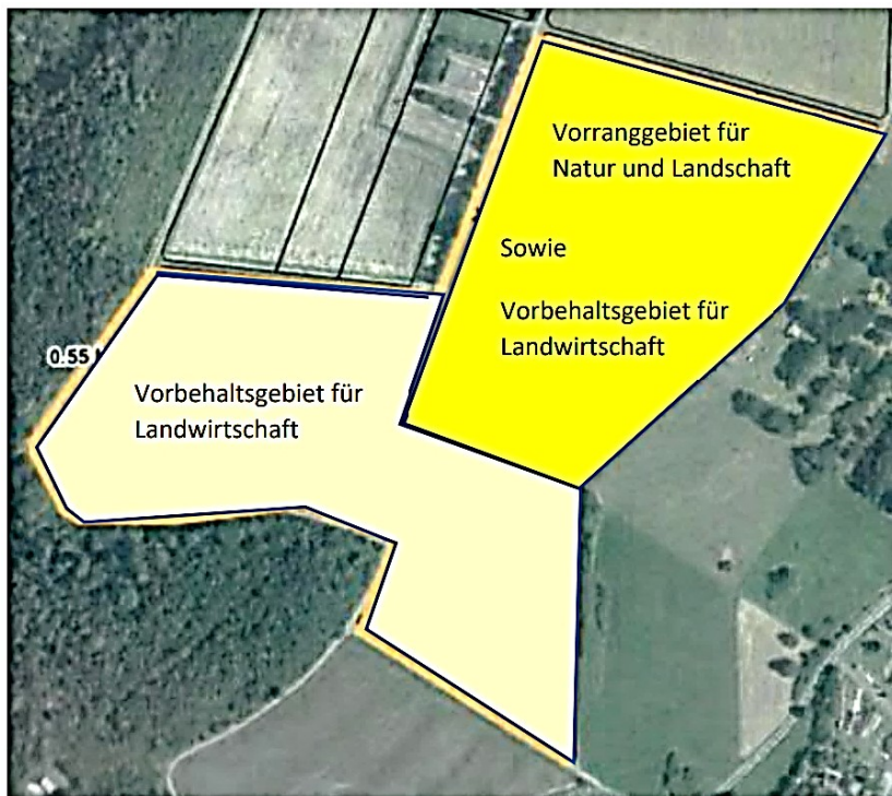
Bild 1: Potentialflächen Feld 1 für FFPVA (Potentialflächen Feld 2 im Bild 2)

Laut Regionalplan Südhessen/Regionaler Flächennutzungsplan 2010 gilt für die von ABO Wind Solar in Betracht gezogenen Flächen an der Ochsenweide: 100% der Flächen gehören zur Kategorie „Vorbehaltsgebiet für Landwirtschaft“. Zudem gehören ca. 50% der Flächen zur Kategorie „Vorranggebiet für Natur und Landschaft“ (vergleiche Bild 1).